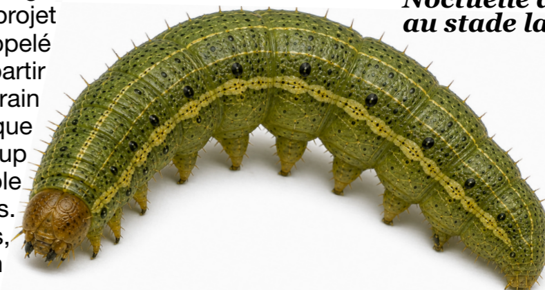
Noctuelle du coton au stade larvaire

« L'olfaction est cruciale pour certaines espèces comme les papillons de nuit »